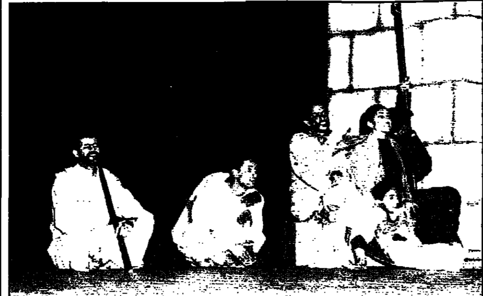
مشهد من مسرحية الغيل يا ملك الزمان لطلبة المعهد

استضاف سعد الله ونوس الذي لا يموت كما وصفته الفنانة اللبنانية نضال الاشقر جمهور المسرح في القاهرة في سهره مع (طقوس الاشارات والتحويلات) وهي مقتبحة عروض المسرحية تقدمها فرقة مسرح المحبة البيروتية وتتواصل لمدة اسبوعين بالقاهرة.